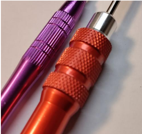
Outils de Précision